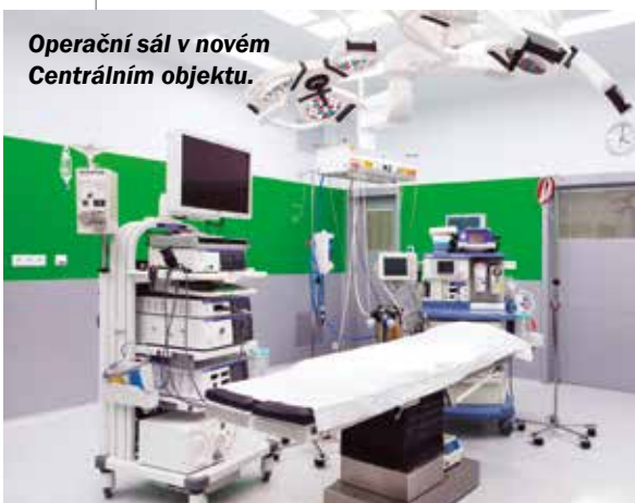
Operační sál v novém Centrálním objektu.

a úrazech, endoskopickou chirurgií kloubů (artroskopií). V plném rozsahu se zabývá léčbou vrozených vad kyčlí, nohou a numerických vad končetin. Zároveň se věnuje řešení poúrazových stavů pohybového systému.