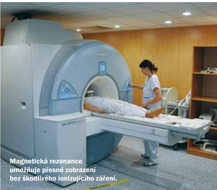
Magnetická rezonance umožňuje přesné zobrazení bez škodlivého ionizujícího záření.

Magnetická rezonance v diagnostické radiologii proti ostatním zobrazovacím metodám umožňuje přesnější zobrazení většiny orgánů lidského těla bez škodlivého ionizujícího záření. Dalšího zlepšení kvality obrazu lze dosáhnout podáním speciálních kontrastních látek, stejně jako u CT vyšetření, která pomohou odhalit přítomnost zánětlivých, nádorových či jiných patologických procesů.