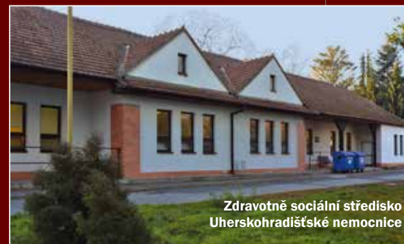
Zdravotně sociální středisko Uherskohradištské nemocnice

Uherskohradištská nemocnice postupně spouští projekt „Voňavá nemocnice“. Do společných prostor jednotlivých oddělení začne umísťovat speciální přístroje, které budou rozptylovat příjemné vůně. Jde o další opatření, jehož cílem je výrazně zlepšit prostředí pro pacienty a jejich návštěvy, ale také pro personál nemocnice.