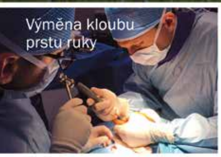
Výměna kloubu prstu ruky