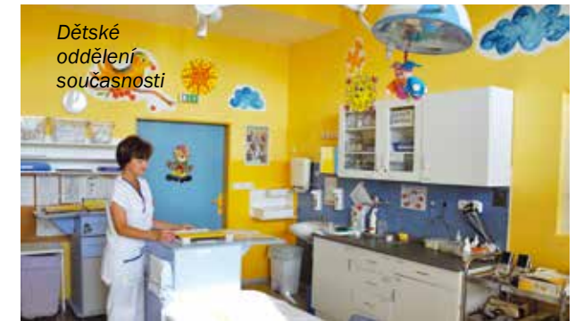
Dětské oddělení současnosti

V provozu jsou všechny specializované ambulance, od roku 2004 je zde dostupná lékařská služba první pomoci pro děti a od roku 2010 i ordinace praktického lékaře pro děti a dorost. V roce 2004 získalo oddělení certifikát Baby Friendly Hospital. Každoročně je zde přijato přes 2 500 pacientů, z toho 1/3 s doprovodem. Sna-