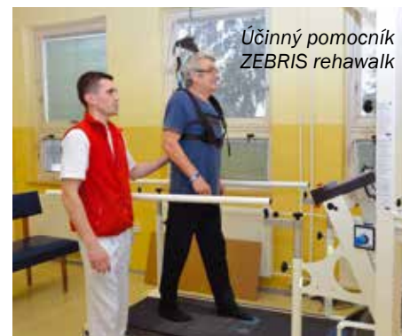
Účinný pomocník ZEBRIS rehawalk

Právě pro nácvik stoje, chůze a ovlivnění svalového napětí slouží jeden z robotů - ErigoPro. Je to robotický, motorem poháněný stavěcí stůl, který umožňuje adaptaci pacienta na vertikální polohu, postupné zatěžování kardiovaskulárního systému a nácvik koordinace pohybu dolních končetin. Robot napomáhá pacientovi ve správném pohybu dolních končetin a uvědomění si tohoto pohybu, zároveň pomocí dráždění receptorů na dolních končetinách podporuje stimulaci mozkových center. V další fázi může nastoupit systém ZEBRIS rehawalk, který v sobě spojuje analýzu stoje, chůze a nácvikový trenažér chůze se senzory tlaku. Mimo jiné umožňuje nácvik ve virtuálním prostředí se zpětnou vazbou a obsahuje modul pro testování vynaloženého úsilí a rovnováhy.