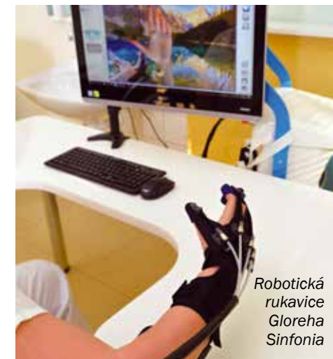
Robotická rukavice Gloreha Sinfonia

Posledním pořizovaným přístrojem je Gloreha Sinfonia, robotická rukavice podporující kloubní hybnost ruky se senzory snímajícími volní pohyby. Každé cvičení je obohaceno o smyslovou stimulaci. Sinfonia rozpozná pacientovy pohyby a s ohledem na jeho schopnosti částečně nebo úplně pomůže s provedením pohybu. Pacient může terapii řídit pomocí zdravé ruky. Pohyby vykonávané zdravou rukou jsou v reálném čase přenášeny na postiženou ruku.