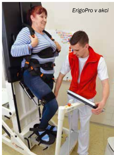
ErigoPro v akci

Jednou z hlavních příčin invalidizace jsou mozkové příhody, protože 40 % nemocných v důsledku poškození mozku zůstane trvale závislých na pomoci druhé osoby při běžných denních aktivitách. Asi u pětiny postižených přetrvává neschopnost chůze, velmi časté je rovněž postižení pohyblivosti horní končetiny a řeči. U takových pacientů přichází na řadu mezioborová spolupráce rehabilitačních lékařů, fyzioterapeutů, logopeda, pracovního terapeuta a dalších. Prvním krokem v aktivní rehabilitaci je nácvik vertikalizace, a to postupně od sedu přes stoj až k chůzi. Poloha ve stoje vede ke zlepšení vědomí a pozornosti u pacientů, kteří ztratili možnost samostatné pohyblivosti nebo byli delší dobu upoutáni na lůžko. Robotické přístroje umožňují podporu a ulehčení pohybu, nebo naopak mohou klást dávkovaný odpor pohybu pacienta, případně zvládnout mnoho opakování přesně vedených pohybů. Nespornou výhodou je i ulehčení fyzické námahy terapeuta.