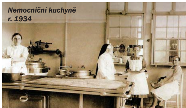
Nemocniční kuchyně r. 1934

Monobloky nebo pavilony? Skoro se zdá, že tato otázka patří do současnosti. Ale není tomu tak. Diskuze na tohle téma se vedly už hodně dávno v historii Uherskohradištské nemocnice. Vraťme se tedy zpět v čase do doby, kdy začala výstavba jednotlivých pavilonů nemocnice.