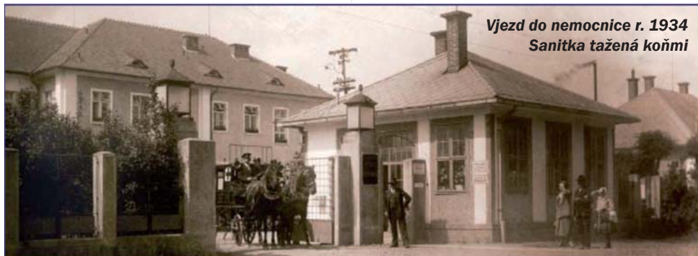
Vjezd do nemocnice r. 1934 Sanitka tažená koňmi

samostatná oddělení – ortopedické a dermatologicko-venerologické. Od roku 1953 začala pracovat onkologická poradna, nemocnice také zahájila odběr krve od dárců uzavřeným systémem a o rok později vznikla nemocniční lékárna. Rok 1954 byl