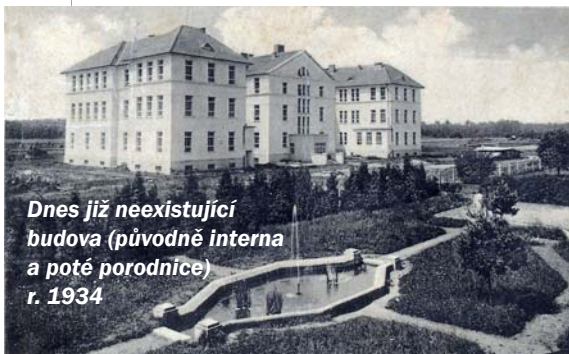
Dnes již neexistující budova (původně interna a poté porodnice) r. 1934