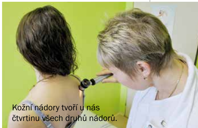
Kožní nádory tvoří u nás čtvrtinu všech druhů nádorů.