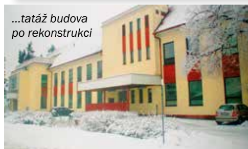
...tamtáž budova po rekonstrukci

primářů na obnovu a doplnění přístrojového vybavení nemocnice. Dařilo se to pomalu, navíc se při nárůstu pacientů