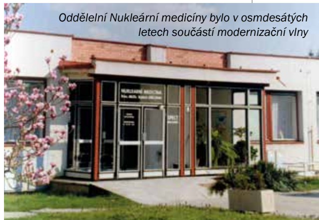
Oddělení Nukleární medicíny bylo v osmdesátých letech součástí modernizační vlny

přestavbou také chirurgické oddělení, kdy kromě rekonstrukce celé budovy došlo i k vybudování klimatizovaných