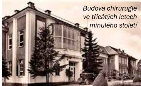
Budova chirurgie ve třicátých letech minulého století

ve výrobě léků i v diagnostice byly ve druhé polovině osmdesátých let podnětem ke zvyšujícím se požadavkům