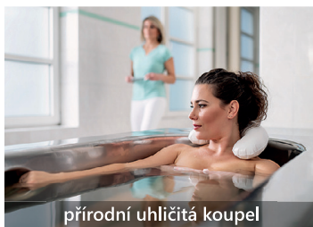
přírodní uhličitá koupel