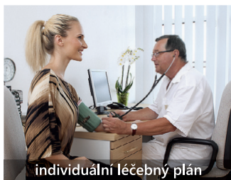
individuální léčebný plán

Požádejte lékaře o návrh na lázeňskou péči nebo přijďte jako samoplátce.