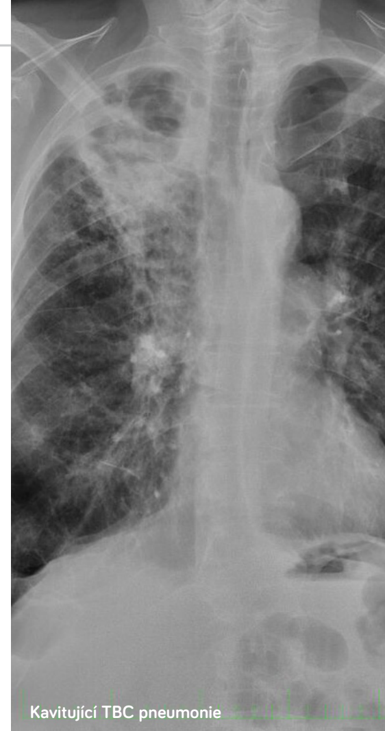
Kavitující TBC pneumonie

Rizikovými skupinami jsou alkoholici, bezdomovci, lidé žijící na ubytovnách, drogově závislí, HIV pozitivní, imigranti (zejména ze zemí s vysokým výskytem TBC), lidé sociálně slabí. V posledních letech se mezi rizikové skupiny řadí také pacienti s biologickou léčbou, pacienti po transplantacích a osoby s oslabenou imunitou. Zvýšené riziko představuje také dlouhodobý pobyt v zemích s vysokým výskytem TBC. U většiny nemocných postižených TBC se nemoc projevuje poklesem hmotnosti, nechutenstvím, únavou, zvýšenou tělesnou teplotou, nočním pocením, vykašláváním hlenohnisavého sputa (hľenu) až vykašláváním krve. Infekce se nejčastěji přenáší kapénkovou cestou.