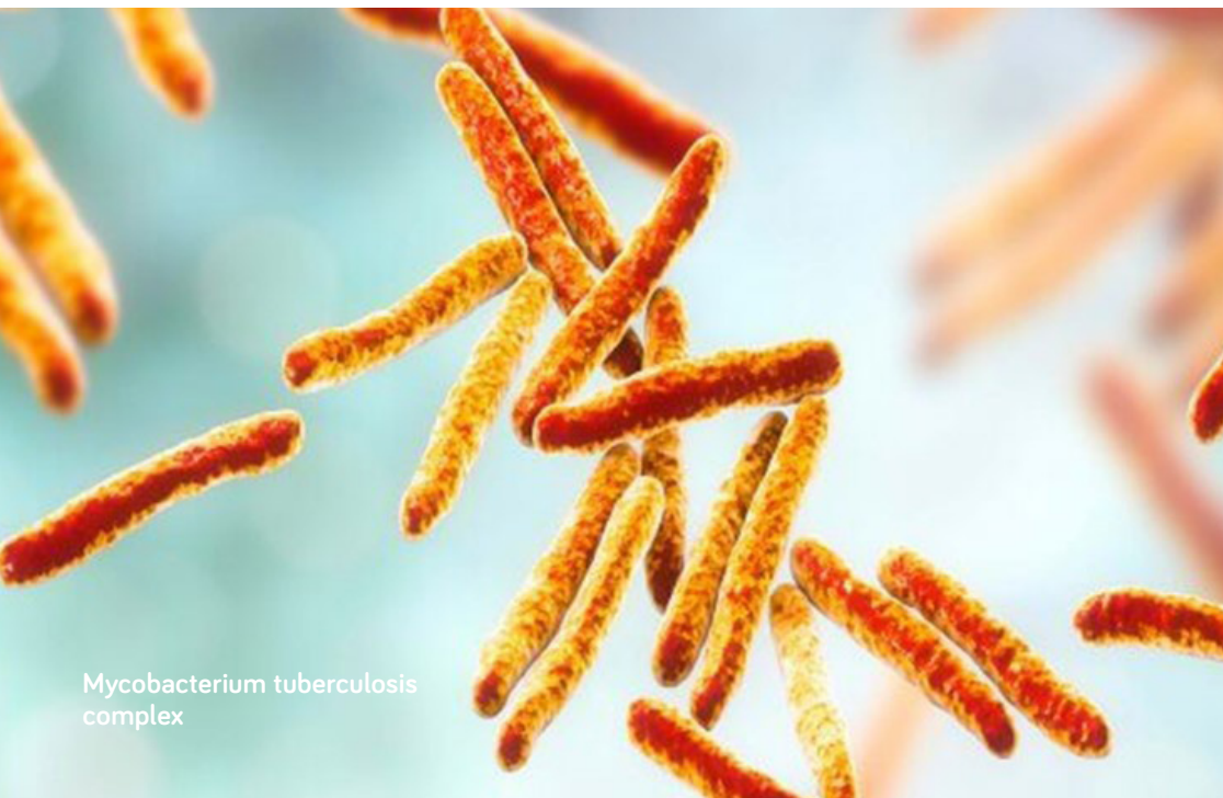
Mycobacterium tuberculosis complex

TBC provází lidstvo již od starověku, byla nalezena v egyptských mumiích starých přes 3000 let. Ve středověku byla známá jako „ bílý mor “ nebo „ souchotiny “. V 19. století způsobovala až 25 % všech úmrtí v Evropě. Na TBC zemřelo mnoho slavných osobností včetně Franze Kafky, Fryderyka Chopina či George Orwella. V českých zemích této nemoci podlehl například i Karel Hynek Mácha či Jiří Wolker.