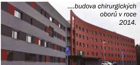
...budova chirurgických oborů v roce 2014.

jednoschodové budově bývalé zdravotní stanice z doby 1. světové války. Nebyla to ale žádná výhra v loterii, protože zpočátku nebyl oddělen provoz lůžkové a ambulantní části,