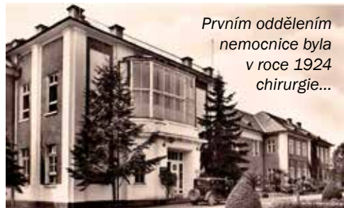
Prvním oddělením nemocnice byla v roce 1924 chirurgie...

Jako vůbec první bylo otevřeno chirurgické oddělení, a to 15. ledna 1924. Svou činnost zahájilo v upravené