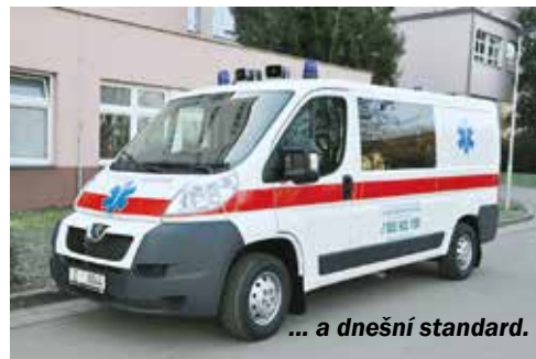
... a dnešní standard.

1925), umístěné v tzv. kamenném pavilonu, dvou dřevěných baráčích a tzv. expektanci. V těchto objektech bylo 94 lůžek pro interní a 42 lůžek pro infekční nemoci. K nejstarším oddělením nemocnice patřilo i oční oddělení, které zahájilo činnost v roce 1928. Začínalo s 90 lůžky, z nichž 50 bylo v novém interním pavilonu, kde byl situován i operační sál, a 40 bylo umístěno v dřevěném pavilonu bývalé zdravotní stanice. Dva roky poté, tedy v roce 1930, byla založena prosekтура, radiologické oddělení zřídili v nemocnici v rámci rozšiřování léčebné péče již v roce 1934. Bylo však umís-