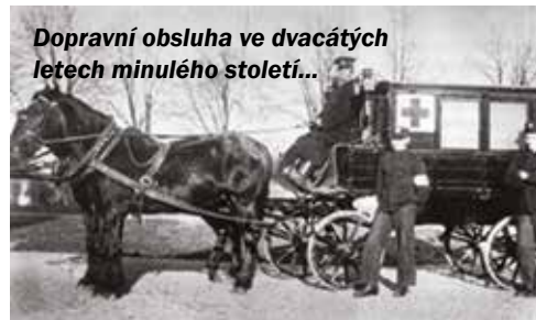
Dopravní obsluha ve dvacátých letech minulého století...

a i počet lůžek nebyl dostačující. Oddělení mělo 140 lůžek, z toho 27 jich bylo určeno pro dětskou chirurgii. Druhým samostatným oddělením nové nemocnice bylo vnitřní oddělení (rok