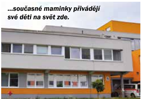
...současné maminky přivádějí své děti na svět zde.

těno v provizorní přízemní budově, a přestože se počet vyšetřovaných roků od roku navyšoval, podmínky pro práci se nezlepšovaly – to nastalo až po druhé světové válce. V roce 1937 bylo ještě v nemocnici v Uherském Hradišti zřízeno otolaryngologické oddělení. Část spolu s operačním sálem umístili v prvním poschodí nového infekčního pavilonu, část v dřevěné budově. V dalším roce 1938