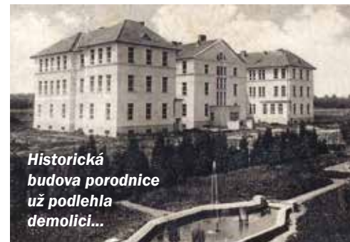
Historická budova porodnice už podlela demolici...

1925), umístěné v tzv. kamenném pavilonu, dvou dřevěných baráčích a tzv. expektanci. V těchto objektech bylo 94 lůžek pro interní a 42 lůžek pro infekční nemoci. K nejstarším oddělením nemocnice patřilo i oční oddělení, které zahájilo činnost v roce 1928. Začínalo s 90 lůžky, z nichž 50 bylo v novém interním pavilonu, kde byl situován i operační sál, a 40 bylo umístěno v dřevěném pavilonu bývalé zdravotní stanice. Dva roky poté, tedy v roce 1930, byla založena prosekтура, radiologické oddělení zřídili v nemocnici v rámci rozšiřování léčebné péče již v roce 1934. Bylo však umís-