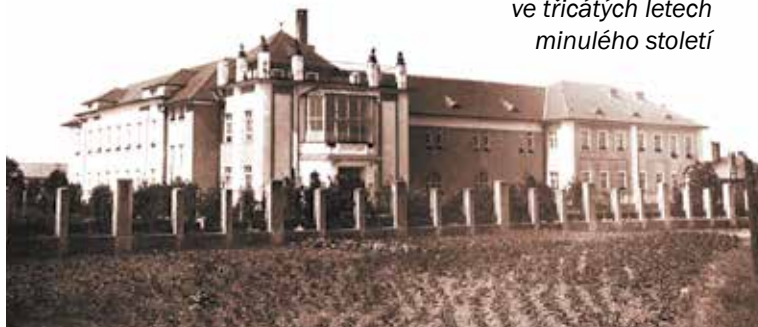
Chirurgie Zemské nemocnice v Uherském Hradišti ve třicátých letech minulého století

K mohutnému rozvoji chirurgického oboru však dochází až po druhé světové válce, kdy je zdokonalena anestezie, jsou objeveny antibiotika a lékařství celkově zaznamenává technický pokrok. Zejména lepší metody anestezie rozšířily také možnosti nemocnice v Uherském Hradišti. Bylo