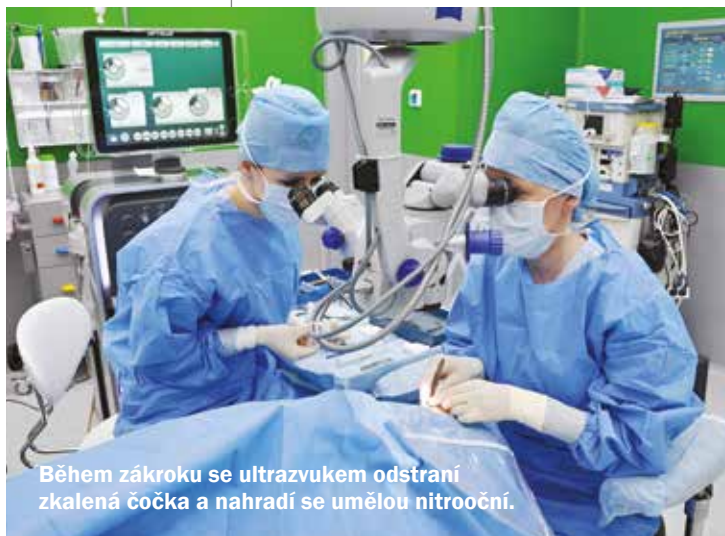
Během zákroku se ultrazvukem odstraní zkalená čočka a nahradí se umělou nitrooční.

Problém šedého zákalu se týká převážně pacientů nad 60 let. „Šedý zákal