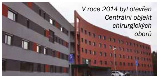
V roce 2014 byl otevřen Centrální objekt chirurgických oborů