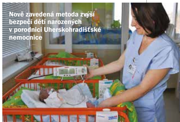
Nově zavedená metoda zvýší bezpečí dětí narozených v porodnici Uherskohradištské nemocnice

Většinu srdečních vad dosud diagnostikovali lékaři při preventivních prohlídkách těhotných žen a porod dítěte s vrozenou srdeční vadou se plánovaně