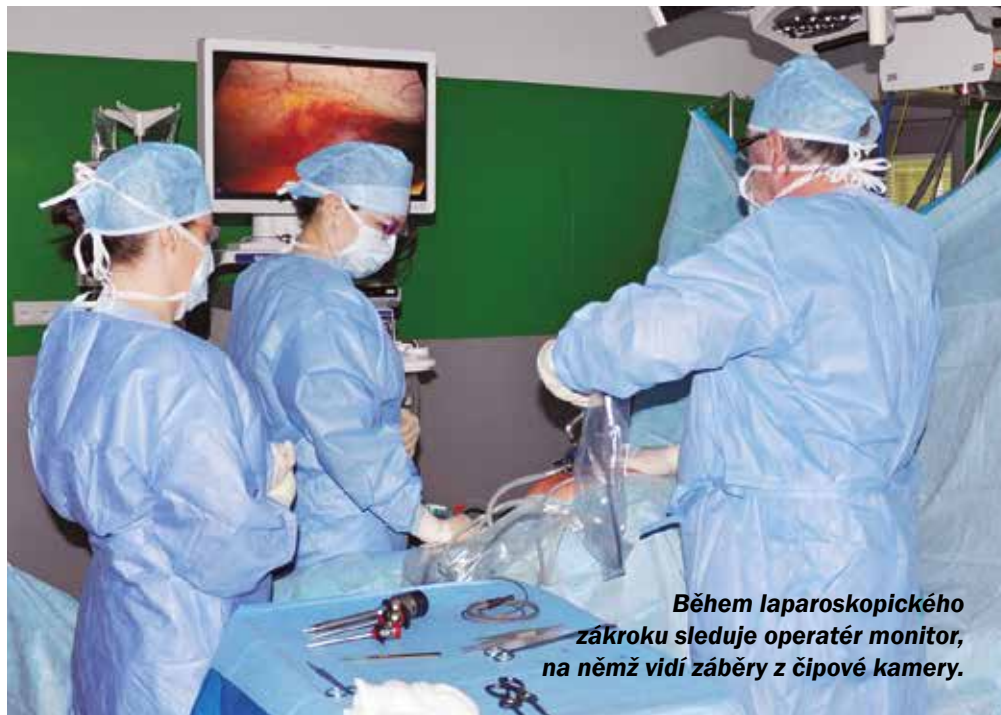
Během laparoskopického zákroku sleduje operatér monitor, na němž vidí záběry z čipové kamery.

Vysvětluje odborník na slovo vzatý, primář chirurgického oddělení a člen představenstva Uherskohradištské ne-