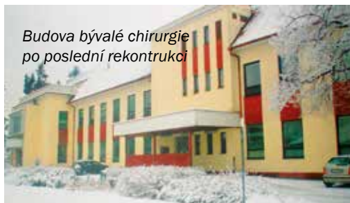
Budova bývalé chirurgie po poslední rekonstrukci