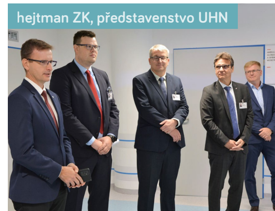
hejtman ZK, představenstvo UHN