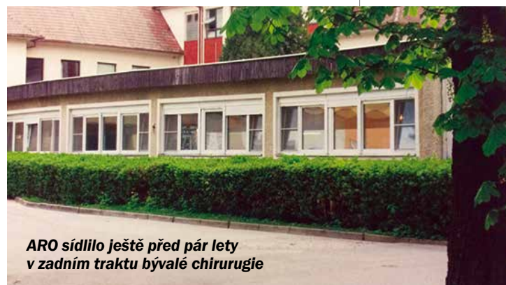
ARO sídlilo ještě před pár lety v zadním traktu bývalé chirurgie

V roce 2013 byla také otevřena anesteziologická ambulance pro pacienty před plánovanými léčebnými a diagnostickými výkony. ARO nyní sídlí v centrálním objektu chirurgických oborů.