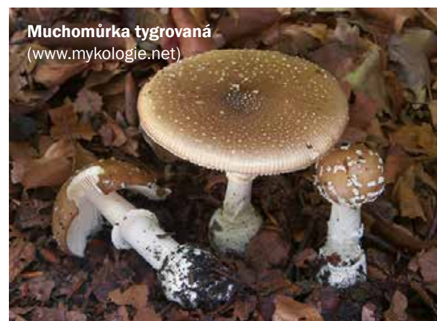
Muchomůrka tygrová

způsobují poškození jater a ledvin a problémem je dlouhá doba mezi požitím hub a prvními příznaky, což může být v rozmezí 8 až 24 hodin. Pokud dojde k požití houby ne zcela známého původu, je nutné co nejdříve vyhledat lékařskou pomoc! Ideální je vzít s sebou zbytek houby či zvratky k následnému mykologickému vyšetření. „Základem léčebného úspěchu při všech typech otrav houbami je důkladné a co nejrychlejší odstranění jedovatých hub z trávicího traktu. Prioritní v tomto případě je výplach žaludku s následným podáním ab-