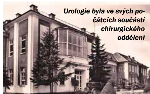
Urologie byla ve svých počátcích součástí chirurgického oddělení

Tento krok byl potřebný, jelikož neustále narůstal počet pacientů spadajících právě pod tuto oblast lékařství. Jako samostatné oddělení však vznikla urologie až