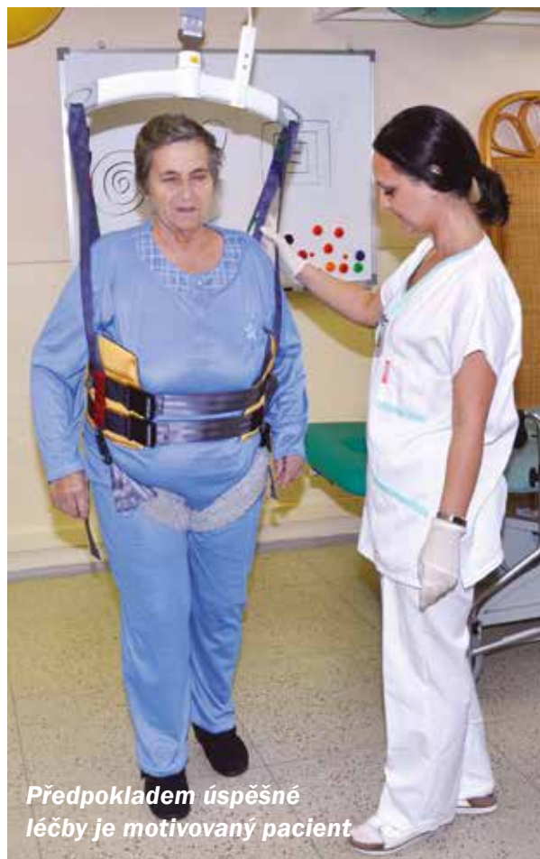
Předpokladem úspěšné léčby je motivovaný pacient

Čím dříve bude pacient náležitě vyšetřen a bude zahájena léčba, tím větší je naděje na minimalizaci následků prodělaného iktu. Ve vyspělých zemích patří cévní mozkové příhody k nejčastějším příčinám úmrtí a invalidizace. Bohužel i přes pokroky v diagnostice a léčbě zůstává stále velká část pacientů po iktu s trvalým postižením. Z etických a sociálních důvodů je pro společnost základním požadavkem, aby ti, kteří přežili cévní mozkovou příhodu, dosáhli