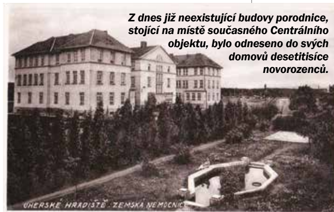
Z dnes již neexistující budovy porodnice, stojící na místě současného Centrálního objektu, bylo odneseno do svých domovů desetitisíce novorozenců.