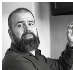
Michal Zetel, ředitel Slováckého divadla