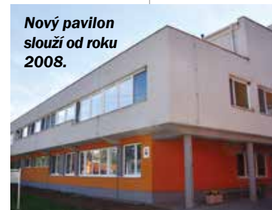
Nový pavilon slouží od roku 2008.

prováděných zákroků. Nejnověji v roce 2008 získalo oddělení nový pavilon. Pokud jde o vedení oddělení, v letech 1978-1988 jej vedl doc. MUDr. Toman