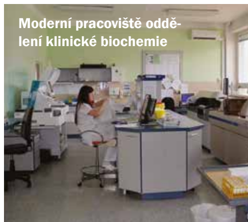
Moderní pracoviště oddělení klinické biochemie