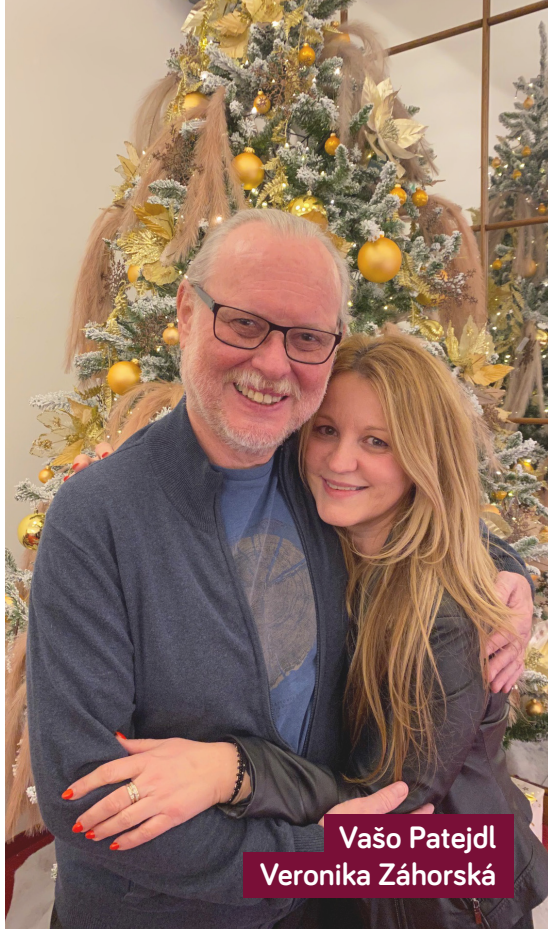
Vašo Patejdl

V prosinci loňského roku vystoupil v místním Klubu kultury UH známý hudební autor, zpěvák, instrumentalista a zakladatel populární skupiny Elán Vašo Patejdl. Část výtěžku ze vstupného se rozhodl věnovat na podporu Uherskohradištské nemocnice, a u této příležitosti poskytl našemu magazínu krátký rozhovor.