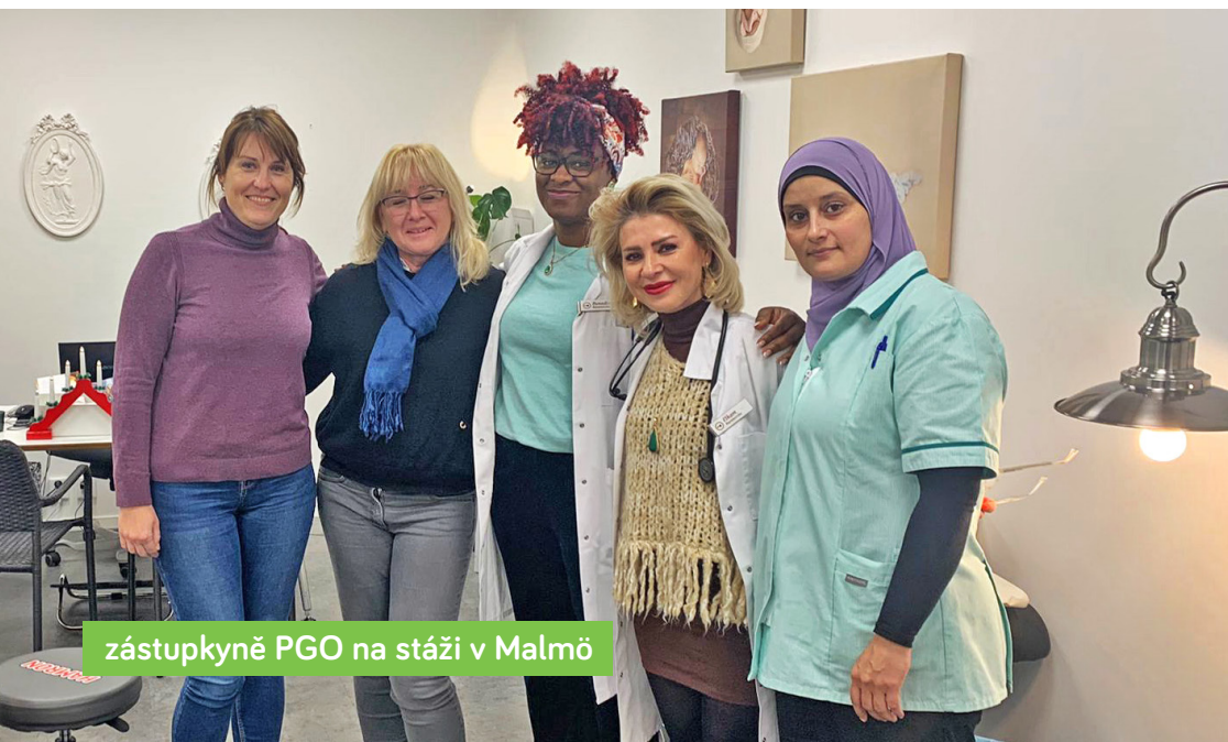
zástupkyně PGO na stáži v Malmö

Ve srovnání s Českou republikou je do švédského zdravotnictví odváděno mnohem vyšší procento HDP (hrubého domácího produktu). Pacienti navíc platí vysoké poplatky za zdravotní péči a na vyšetření jsou mnohem delší čekací doby. Systémově jsou však země kvalitou medicíny srovnatelné.