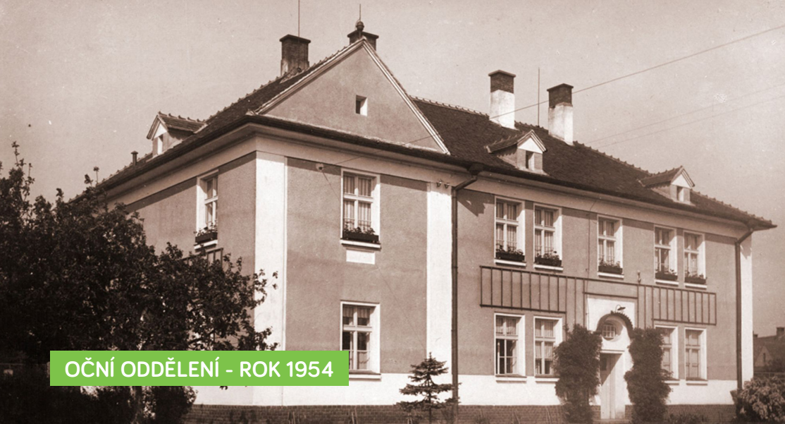
OČNÍ ODDĚLENÍ - ROK 1954