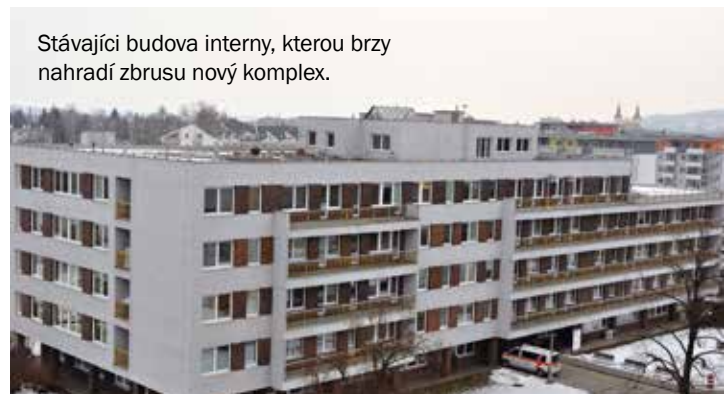
Stávající budova interny, kterou brzy nahradí zbrusu nový komplex.