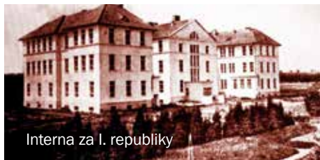
Interna za I. republiky

a dalších. Tehdejší neutěšené sociální a hygienické poměry si vyžádaly soustavnější péči o tuberkulózu a jiné infekční choroby. Postupem času se epidemiologická situace zlepšovala, a tak začaly na interním oddělení převažovat choroby cerebrovaskulární. Po plicních onemocněních byly nejrozšířenější chlopenní vady srdeční, interna tehdy řešila i péči o neurologické pacienty, a to až do vzniku neurologického oddělení v roce 1951.